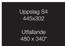
UPPSLAG S4 445x302 mm, 53.500:-