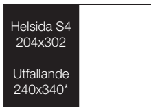
HELSDIDA S4 204x302 mm, 33.600:-