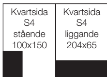
KVARTSIDA S4 stående 100x150 mm liggande 204x65 mm 11.200:-