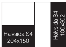
HALVSIDA S4 liggande 204x150 mm stående 100x302 mm 19.400:-

*Tillägg med 3 mm på alla fyra sidor för utfallande annonser.